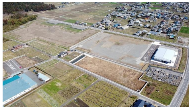
テクノハウス大野 全景